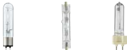
Tabel 3: Eksempler på lyskilder som ikke er omfattet af krav i hverken den ene eller den anden forordning.

Højtryksdampplamper med f.eks. G12, PG12-, R7x og mange andre sokler