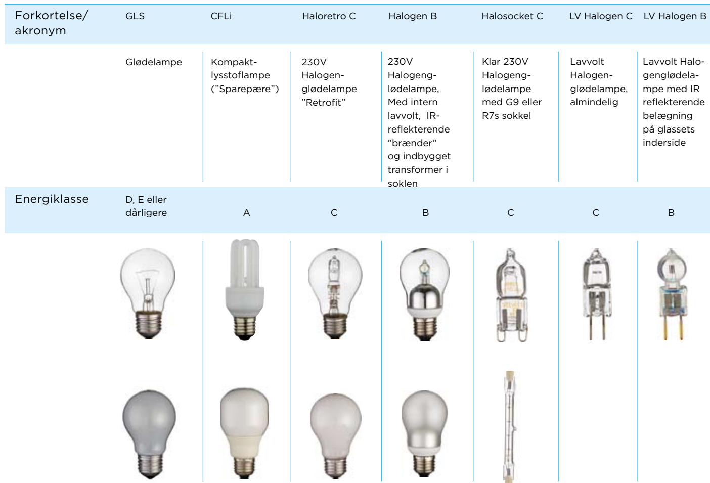
Tabel 2: De almindeligste ikke-retningsbestemte lyskilder i boliger med forkortet navn (acronym) og beskrivelse. Omfattet af 2. forordning.