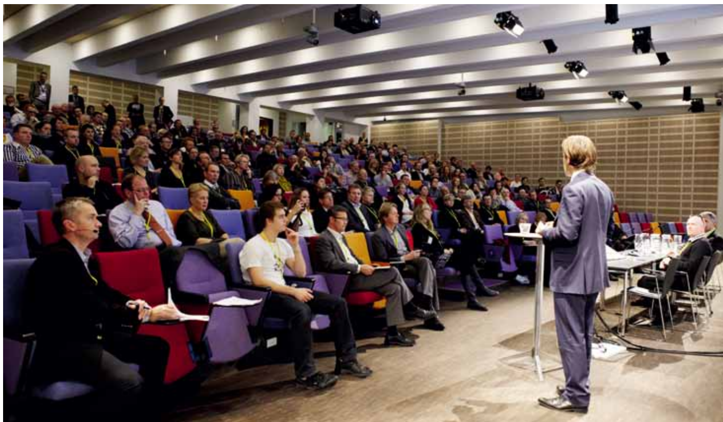
Der var 300 deltagere til konferencen, der blev afholdt i Tivoli Congress Center.