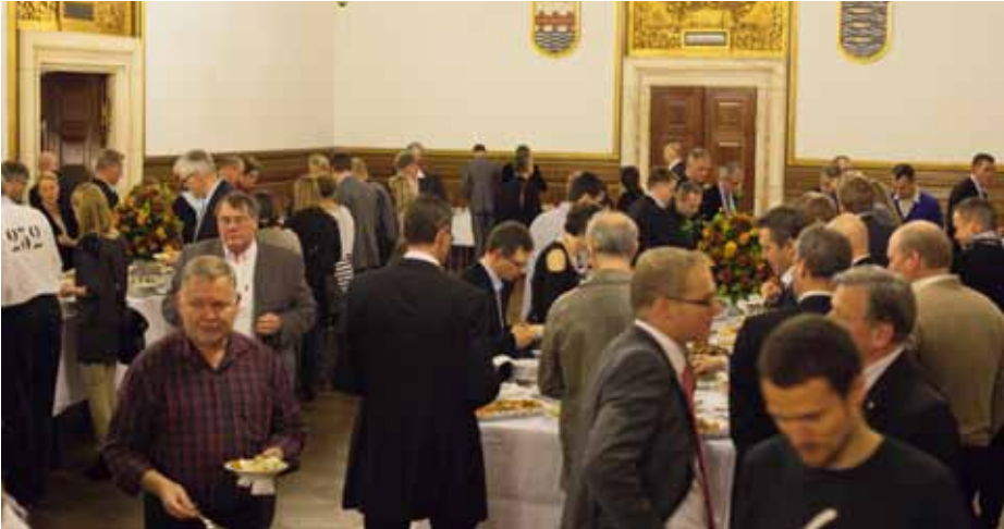
Reception på Københavns Rådhus.