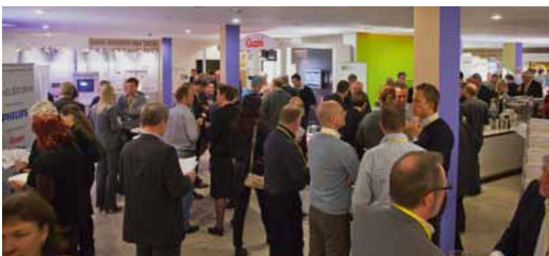
I pauserne var der trængsel i udstillingsområdet uden for konferencesalen.