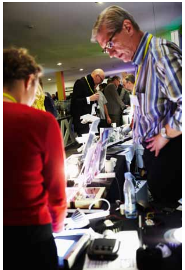
Kaffepause med udstilling af LED i baggrunden.