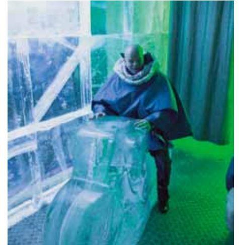
Besøg på Icebar.